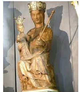
Das Gnadensbild der Madonna vom Soon

Die Pilgermesse in Spabrücken für die gesamte Pfarrei Rupertsberg feiern wir um 11.15 Uhr.